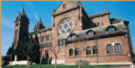
4 Eglise de Merville.