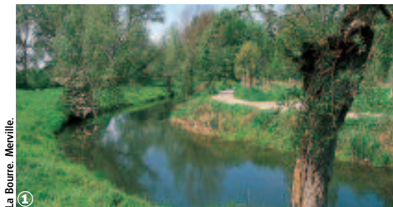
1 La Bourre. Merville.

Une sélection des 30 plus belles balades