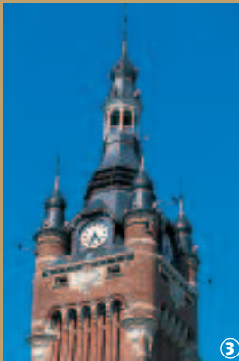
3 Belfroi de Merville.

La réponse est Louis Cordonnier, architecte Lillois, qui eut en charge un vaste programme de reconstruction du département après les destructions de la Première Guerre Mondiale. Il procéda à la rénovation, entre autres, des Hôtels de ville d'Armentières,