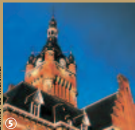
5 Belfroi de Merville.

L'Eglise Saint-Pierre fut également reconstruite à partir de 1924, selon les plans du célèbre architecte ; elle se distingue par deux hautes tours, surélevées d'une calotte byzantine, qui encadrent la façade du sanctuaire. Il a en réalité, redonné vie à un édifice, une première église ouverte au culte en 1887 et incendiée en 1918, dont il avait été le concepteur.