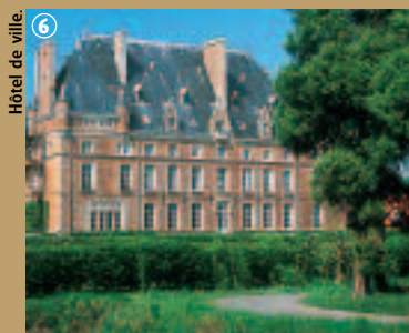
6 Hôtel de ville.

Il a inscrit sa marque de fabrique dans tous ces édifices puisqu'ils ont tous le style de l'architecture flamande de la Renaissance. Ainsi, l'Hôtel de ville de Merville fut inauguré le 7 avril 1929.